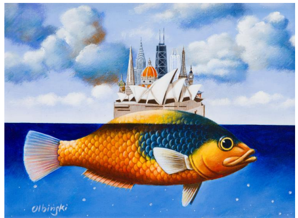
Rafał Olbiński „Yellow submarine”