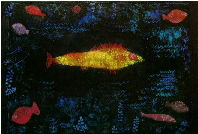
Paul Klee „Goldfish”