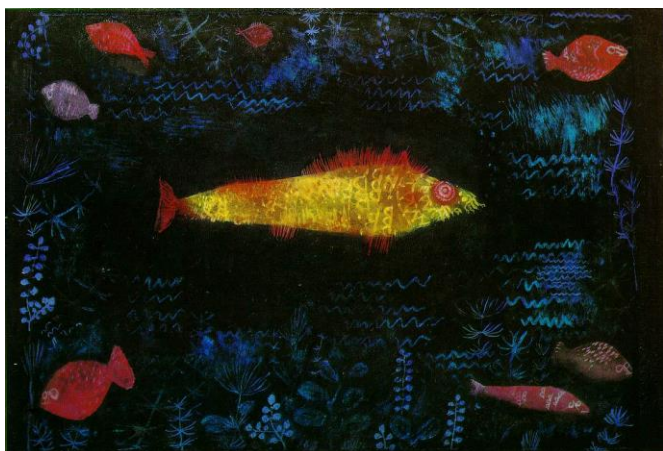
Paul Klee „Goldfish”