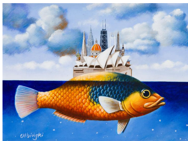
Rafał Olbiński „Yellow submarine”